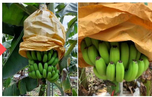
檢查成熟度及採收